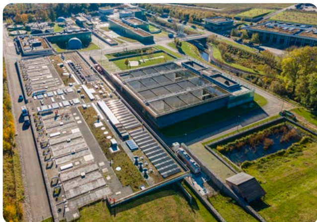
Station d'épuration Carré de Réunion

À l'inverse, si vos eaux pluviales se déversent dans les réseaux d'eaux usées, elles peuvent, en cas de fortes pluies, les faire déborder. Elles nuisent aussi à l'efficacité du traitement en station d'épuration, et peuvent générer une pollution de l'eau une fois restituée dans le milieu naturel.